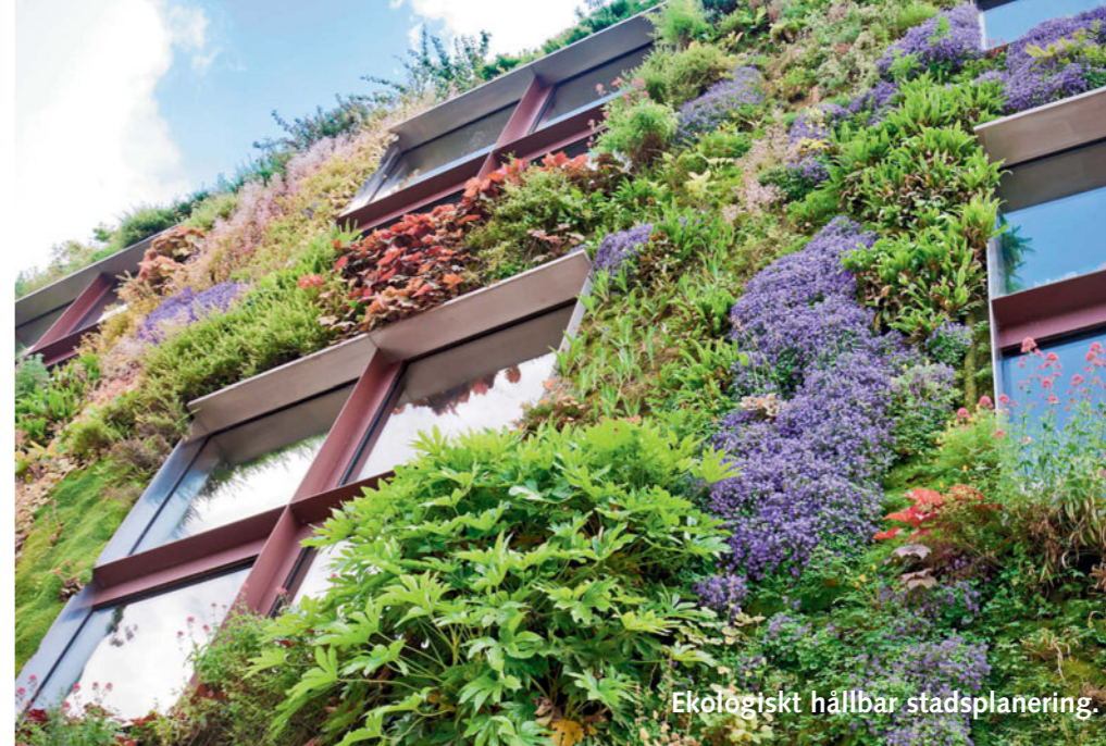
Ekologiskt hållbar stadsplanering.

- Jag vill ge människor konkreta verktyg att arbeta med för att skapa vackra, enkla, roliga och hållbara liv. Jag gör det genom olika ingångar i livet till exempel inredning eller ledarskap.