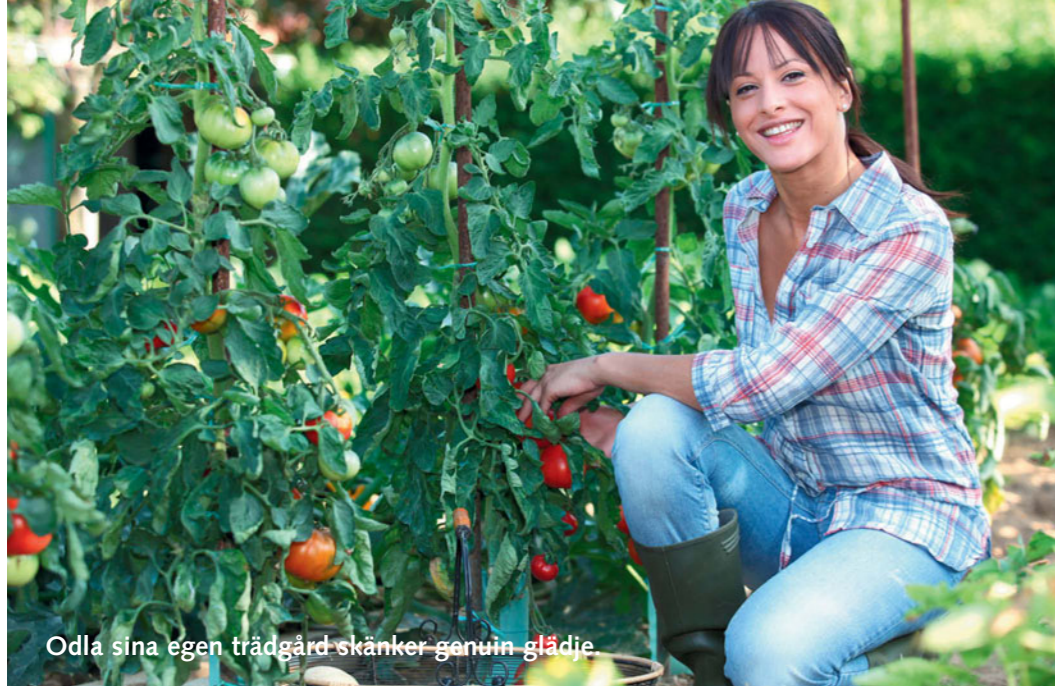
Odlå sina egen trädgård skänker genuin glädje